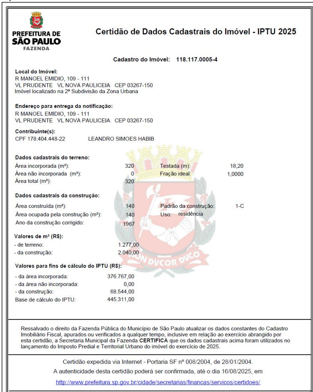
Imagem 07: Imóvel localizado em Zona ZEU conforme informações da Prefeitura Municipal de São Paulo – SP