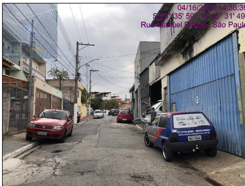
FOTO 01: Vista do acesso pela Rua Manoel Emidio, onde se encontra o imóvel avaliando.

A signatária diligenciou ao imóvel avaliando, obtendo fotografias, as quais, a seguir, serão apresentadas, todas precedidas por cabeçalhos explicativos dos temas nelas enfocados, lembrando que referidas fotos retratam tão somente a atual situação do local, observadas em 16 de abril de 2025 .